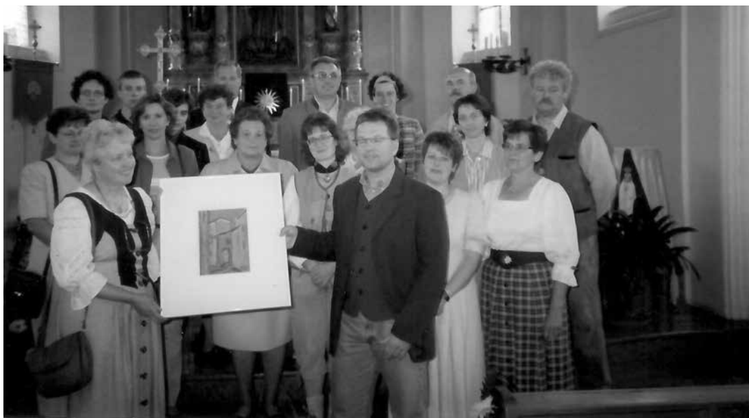
Oswalder Kirchenchor 1999.