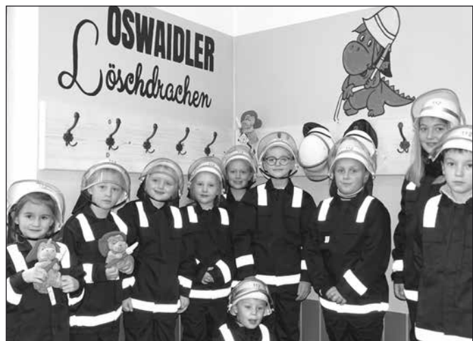
Text/Fotos: FF St. Oswald