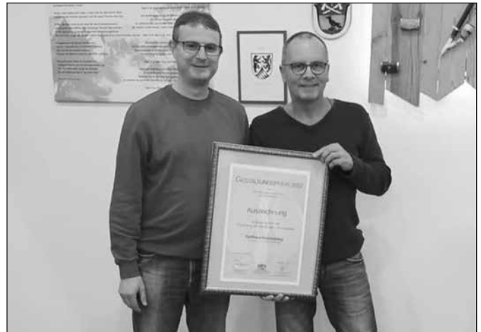
Facebookseite Dorfverein Reichenberg

Den Gestaltungspreis 2022 der ILE Nationalparkgemeinden Bayerischer Wald erhielt das Dorfhaus Reichenberg. Herzlichen Glückwunsch dazu und danke für das große Engagement.