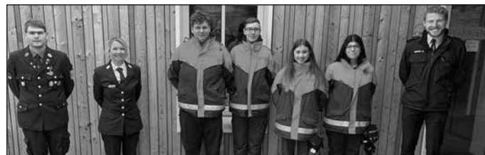
Text/Fotos Facebook Seite FF St. Oswald

Herzlichen Glückwunsch an unsere Jugendfeuerwehr zum bestandenen Wissenstest.